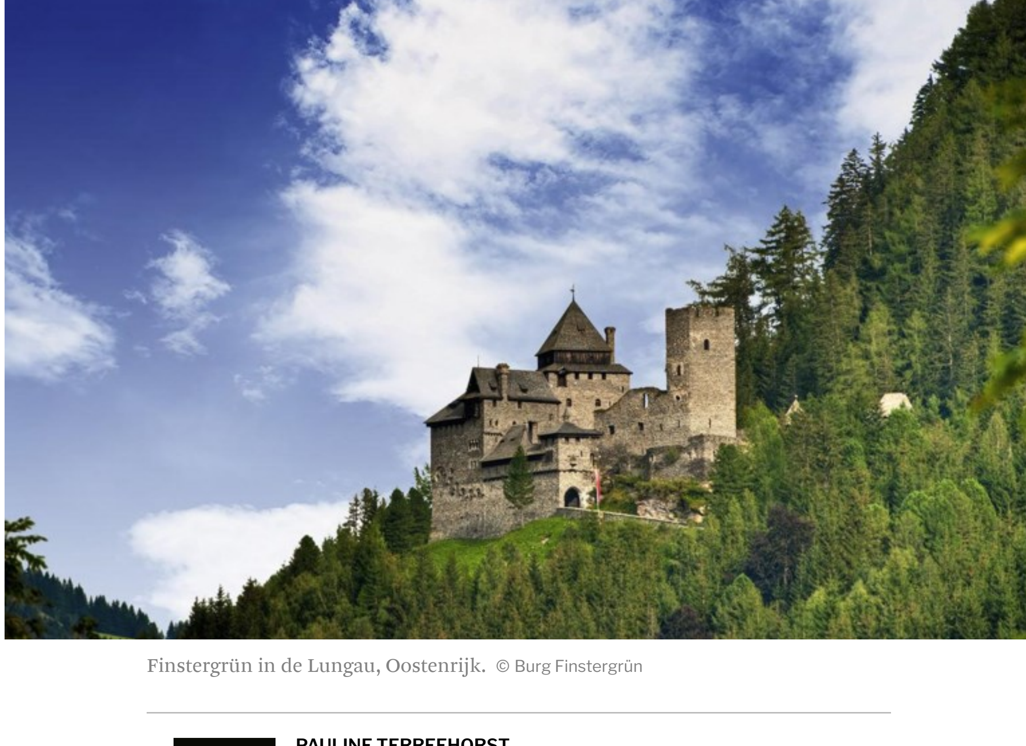
Finstergrün in de Lungau, Oostenrijk.

Peter Jacobs Zaterdag 9 januari 2021 om 3:25 uur